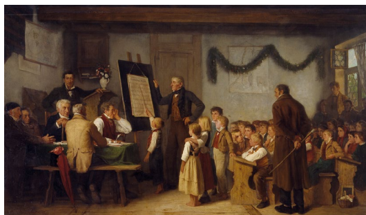
04 Albert Anker Das Schulexamen , 1862 Öl auf Leinwand 103 x 175 cm Kunstmuseum Bern, Staat Bern