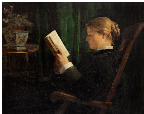
02 Albert Anker Die Lesende , 1883 Öl auf Leinwand 94 x 110 cm Musée des Beaux-Arts, Le Locle