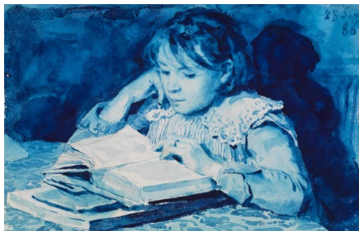
01 Albert Anker Cécile Anker , 28. September 1886 Blaue Fayencefarbe auf Papier 16,9 x 23,3 cm Centre Albert Anker, Ins

Alle Urheberrechte bleiben vorbehalten. Die Bildlegende muss vollständig übernommen und das Werk wie abgebildet reproduziert werden. Die Bilder dürfen nur im Zusammenhang mit der Berichterstattung zur Ausstellung Albert Anker. Lesende Mädchen verwendet werden.