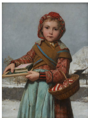
03 Albert Anker Schulumädchen mit Schiefertafel und Nähkörbchen , 1878 Öl auf Leinwand 60 x 47,5 cm Stiftung für Kunst, Kultur und Geschichte, Winterthur